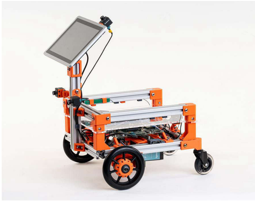
圖 2. TechNexion 「Rovybot」AMR 示範，具有底盤的 ROVY-4VM-EVK

透過使用如 TechNexion ROVY-4VM 等 SoM，設計師即可根據模組開發 AMR 產品，從而簡化設計程序。ROVY-4VM 將處理器、電源管理 IC (PMIC) 和記憶體 (DDR、UFS、SPI NOR 快閃記憶體) 整合在經過完整測試且可立即生產的單一 PCB 上，且處理器的所有其餘週邊設備均可便利地路由至板對板高密度互連 (HDI)。雖然設計師可以自由使用其所選功能從頭開始設計載板，不過 TechNexion 打造了 ROVY-4VM-EVK ，這是一款適用於 ROVY-4VM 的完整 AMR 專用套件 (如 圖 2 中的 AMR 示範所示)。此套件可做為參考設計使用，以快速實現多種功能，例如使用 FPD-Link™ III 技術 ( TECHN-3P-VLS3-X-SL ) 新增最多 8 個隨插即用攝影機、新增顯示器 (同樣利用 FPDLink III)、利用標準或單對乙太網路擴充乙太網路埠，以及易於簡單存取的標準 USB3/Gb 乙太網路埠，以快速進行原型設計與開發。