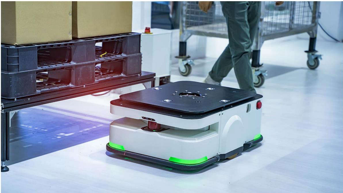
圖 1. 在倉庫環境中的自動行動機器人

機器人系統設計師現正面臨設計複雜性持續提升的情況，因為他們必須設法滿足大家對自動化程度更高的機器人的需求。這種複雜性與日俱增的趨勢在與人類緊密協作的機器人中尤為普遍，例如協作機器人和自主移動機器人 (AMR) 等，如 圖 1 所示。為了確保前述機器人能可靠地與人類合作，且能可靠地在人類附近運作，這些機器人需要更多電子元件。因此，這類機器人中的嵌入式處理器變得越來越複雜，必須針對系統中不斷增加的資料量進行分析並做出回應，以實現如感知、導航和動作控制等功能。