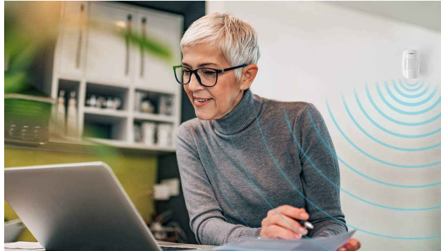
图 1-2. 雷达健康状况监视

由于更好的便利性和舒适性，老年人也更喜欢在睡眠期间进行非接触式生命体征监测。任何接触式监控传感器都可能干扰用户的睡眠，从而降低睡眠质量。由于雷达对距离变化非常灵敏，因此可以检测到人的胸部因心跳和呼吸而发生的移动。因此，可以在病床区域安装雷达，并监控人员的重要信息，包括呼吸频率、心率、血压、睡眠质量。如果医疗保健提供商需要进行密切监控，雷达还可以精确地确定患者在房间中的位置。