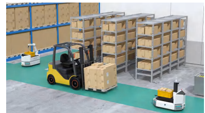
图 1-5. 自动化工厂