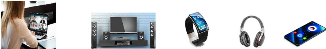
图 1-1. 具有毫米波传感器的个人电子产品示例

第三种应用是智能电视。毫米波传感器可以检测电视前面是否有人，因此电视可以在前面没人时自动切换到低功耗模式。此外，观看者的定位信息（包括距离和角度）可用于自动优化视觉和音频质量，从而改善用户体验，不受观看者在房间中的位置的影响。