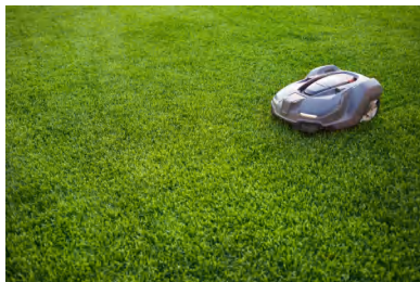
图 1-3. 割草机器人

在室外空间，雷达可用于最后一公里的送货机器人。雷达可以显著提高交付效率，无需送货人挨门挨户配送。雷达也是施工车辆的明智选择，这些车辆通常在具有大量灰尘的恶劣环境中工作。借助雷达，这些建筑车辆可以安全自主地工作。机器人割草机是另一种应用，在这种应用中，雷达可以发挥很多作用。检测树枝和小动物等障碍物有助于割草机智能导航。