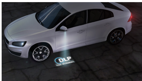
图 2 从侧视镜向地面投影徽标的小车外灯。

DLP 技术可大大扩展汽车小车外灯的功能，包括车门内部、脚踏板或侧视镜底部位置的小车外灯（图 2）。DLP 技术无需其他可移动组件即可生成动态图像。因此，当驾驶员靠近车辆时，可使用小车外灯从侧视镜投影轮胎压力低或车门打开警告，或从小型车门的底部投影车辆徽标或其他样式的图像和视频。利用这些功能，原始设备制造商可通过小车外灯，而不是如今车灯生成的静态徽标，来充分定制传播讯息和进行品牌推广。车灯只能显示单一图案，无法用于与行人或驾驶员通信。