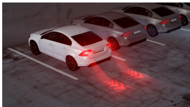
图 4 驾驶员可通过后灯在车后的地面上投影行驶路线，从而广播其预期轨迹。

将要退出车道并有盲点的车辆可通过投影表明其退出意图。平行泊车或倒车等自主功能可向后投射其路径，指示其最终泊车位置，从而将其意图清楚地传达给经过的车辆和骑车人（图 4）。