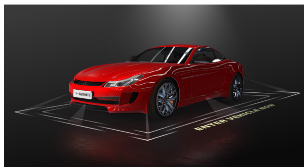
图 3 从车辆上的多个位置投影的汽车光毯。

侧视镜灯可同时执行多种功能，用作标准转向信号以及在车辆侧面区域投射跨越整个车辆长度的光毯（图 3）。当驾驶员在光照昏暗的区域或是在夜间离开或接近车辆时，这类照明尤其有用。