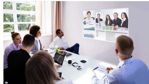
図 2. 1080p フル HD DLP® テクノロジーを使用したオフィス ルームのディスプレイ